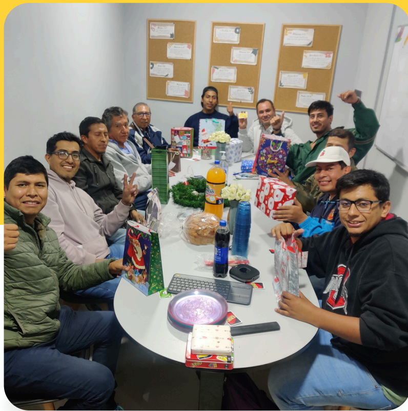
Red de Hombres

Agradecemos a cada persona, familia, y ministerio que ha sembrado con amor, esfuerzo y oración para hacer realidad esta visión. Que cada piedra colocada, cada mano que sirvió, y cada corazón que creyó, reciba abundante bendición.