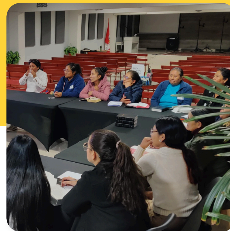
Red de Damas