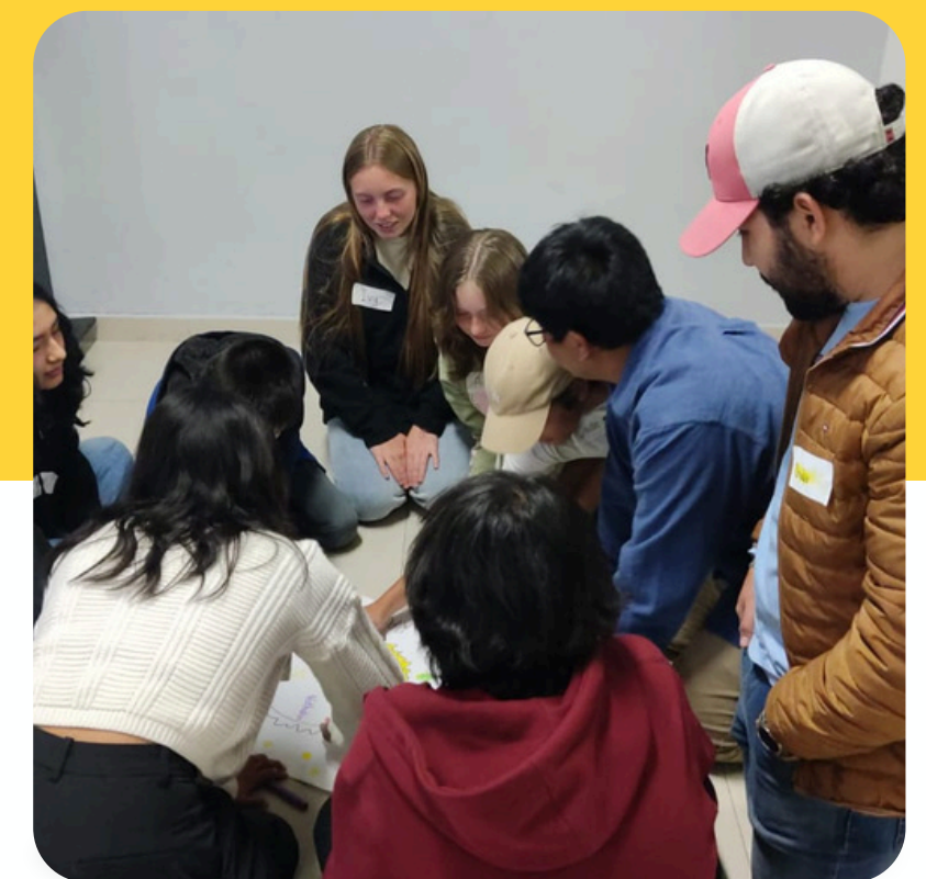
Comunidad de Jovenes